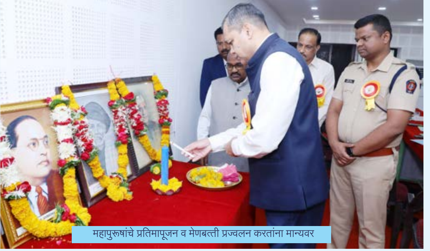
महापुरुषांचे प्रतिमापूजन व मेणबत्ती प्रज्वलन करतांना मान्यवर

अभ्यासाला सुरुवात होवून त्यामध्ये मोठ्या संख्येने विद्यार्थी या उपक्रमामध्ये सहभागी झाले होते.