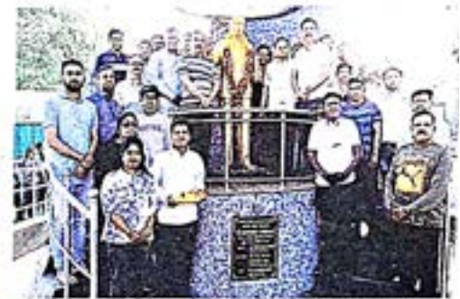
डॉ. बाबासाहेब आंबेडकर यांच्या पुढाकाराने अभिवादन करण्यात आले.