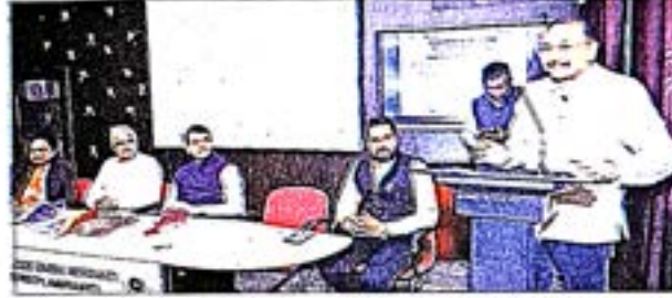
One of the guests guiding the programme.