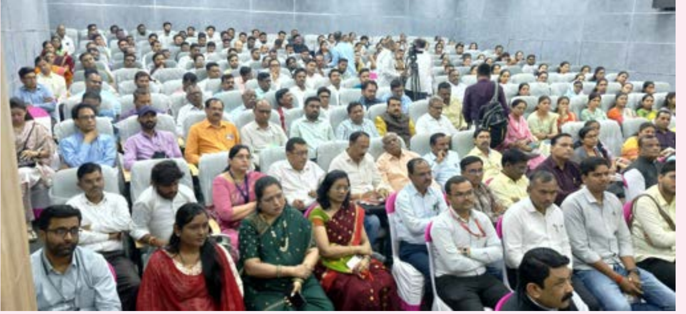
कार्यशाळेला उपस्थित संशोधन मार्गदर्शक, प्राध्यापकवृंद, संशोधक विद्यार्थी