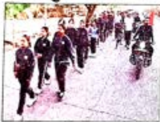
भास्कर डेस्क | अमरावती

■ समता दौड़ के आयोजन पर रखे विचार एक साथ दौड़े हजारों विद्यार्थी और अधिकारी