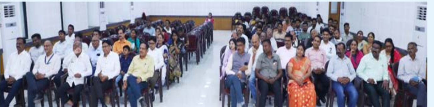
कार्यक्रमाला उपस्थित मान्यवर