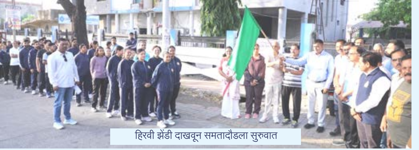
हिरवी झेंडी दाखवून समतादौडला सुरुवात

संत गाडगे बाबा अमरावती विद्यापीठातील डॉ. आंबेडकर अभ्यास केंद्राच्यावतीने समता सप्ताहनिमित्ताने आयोजित समता दौडला उत्स्फूर्त प्रतिसाद मिळाला. विद्यापीठाचे अधिकारी, प्राचार्य, शिक्षक, कर्मचा-यांसह विद्यार्थी-विद्यार्थिनी मोठ्या प्रमाणात सहभाग घेतला.