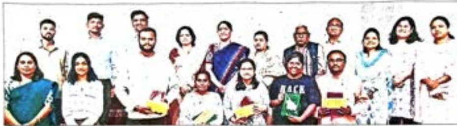
Dignitaries with winning students at SGBAU.