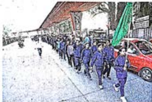
समता दौडमध्ये सहभागी झालेले विद्यार्थी.