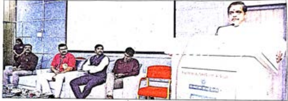
Guest guiding at the workshop at SGBAU.