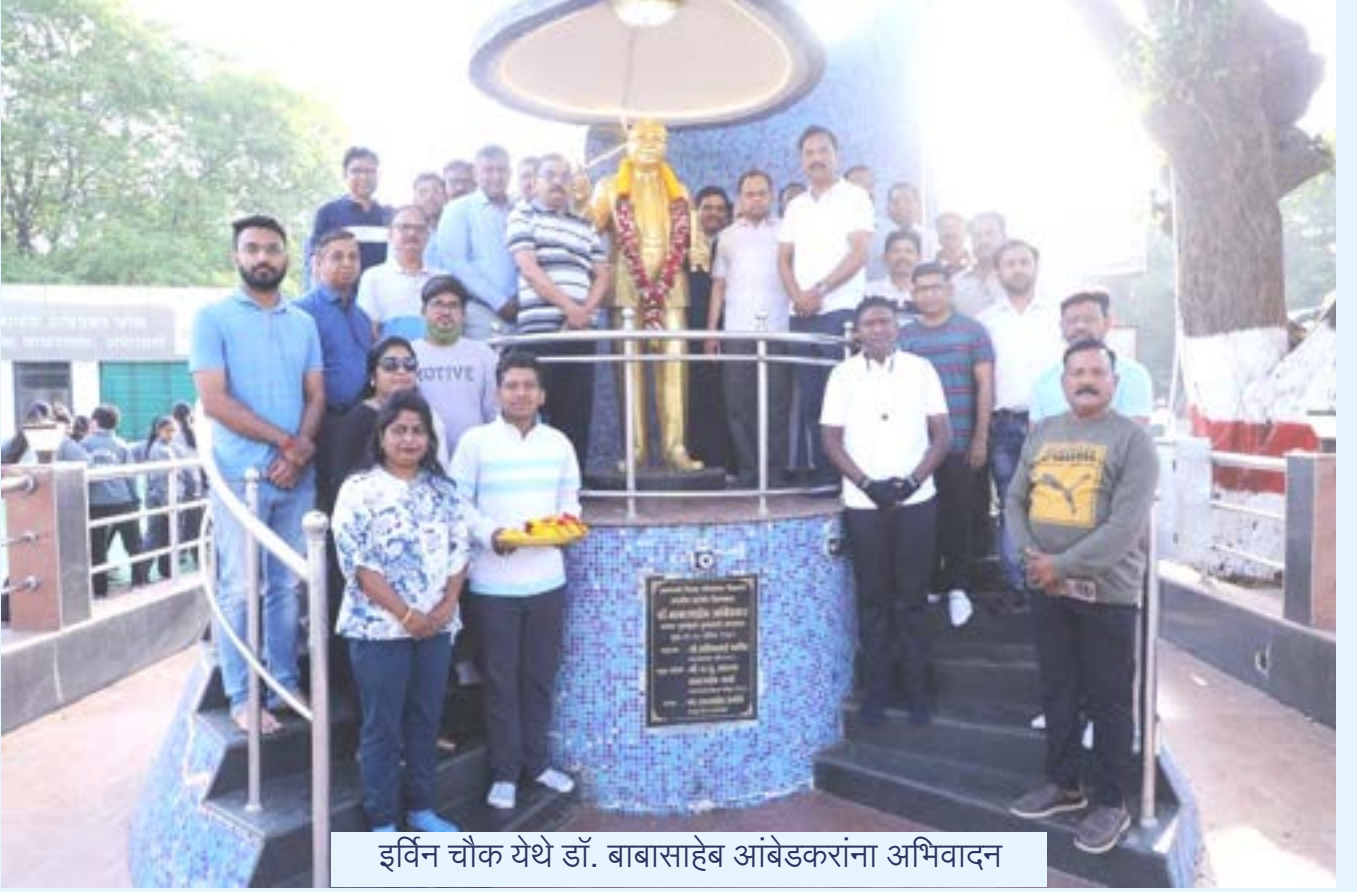
इर्विन चौक येथे डॉ. बाबासाहेब आंबेडकरांना अभिवादन