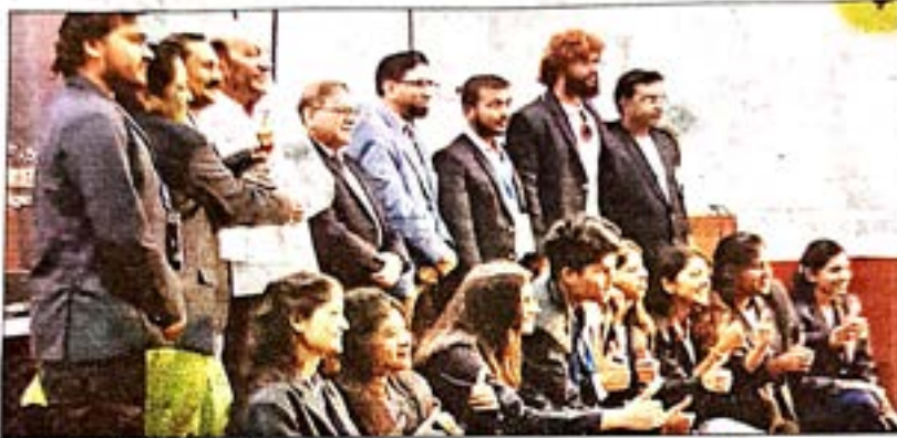
विद्यापीठाची विजेती कव्वाली चम