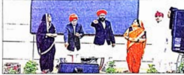
Artists presenting 'Jyotibachi Sawli, Savitri Mauli' play.